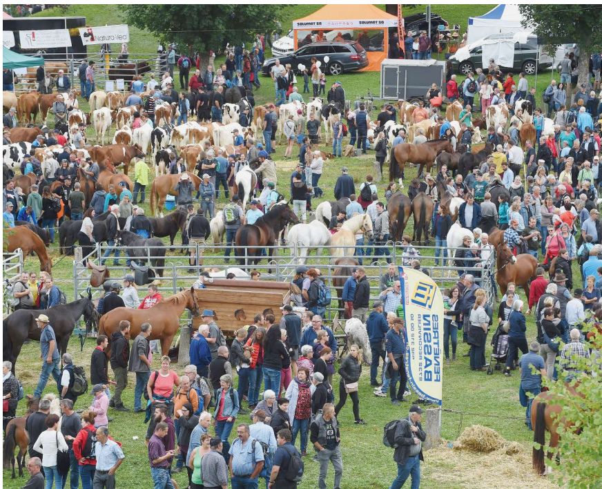
Le champ de foire de Chaindon reste l'endroit idéal pour admirer vendre et acheter les plus belles bêtes de la région.

PAR BLAISE DROZ