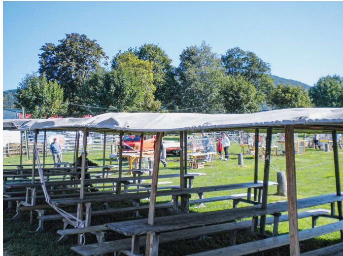
Le château branlant a été érigé en 2010 pour la dernière fois. LDD

Toujours est-il que depuis ce temps-là, les choses ont bien changé. Les agriculteurs et autres visiteurs ne s'intéressant qu'aux machines et au bétail, n'ont plus besoin de descendre «en ville» pour se sustenter. Ils peuvent passer l'entier du lundi uniquement là où se trouvent leurs pôles d'intérêt. C'est