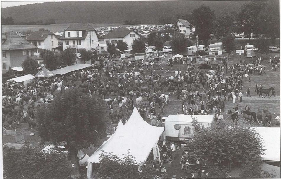
A la Foire de Chandon, le champ de foire reste un passage incontournable.

Le vert est mis. La mise en application de la nouvelle loi sur la vaisselle réutilisable pour cette édition 2019 n'a pas été de tout repos, les délais étant relativement restreints pour réaliser un travail de cette ampleur. En effet, la commission de la Foire de Chandon n'a pas chômé. Elle s'est en-