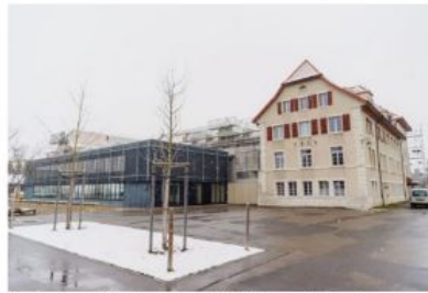
L'ancien Foyer d'éducation servira d'abri à des requérants en transit. LEO

« Les autorités du Plateau ont été tenues au courant par le canton et la population à aussi connaissance de ce projet, ajoute notre interlocuteur.