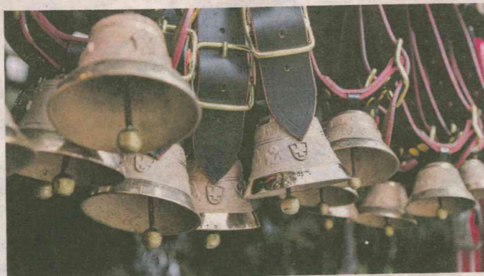
Le défi de réunir entre 80 et 100 sonneurs de cloches a été lancé.